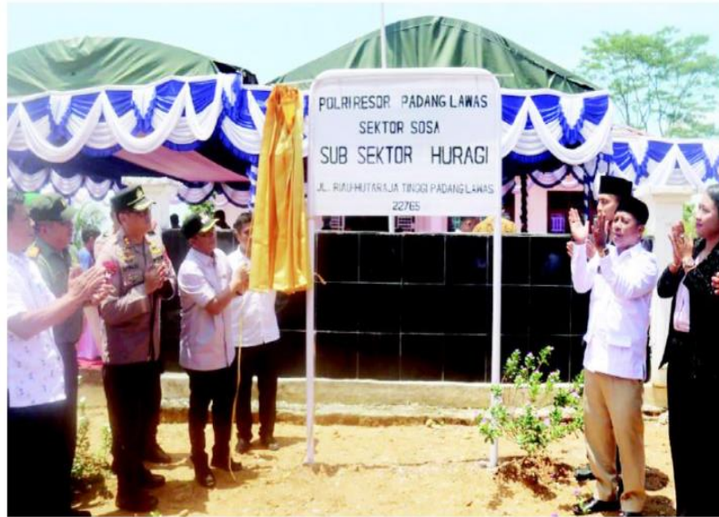
PERESMIAN: Peresmian Polsubsektor di Kecamatan Hutaja Tinggi Kabupaten Padanglawas.