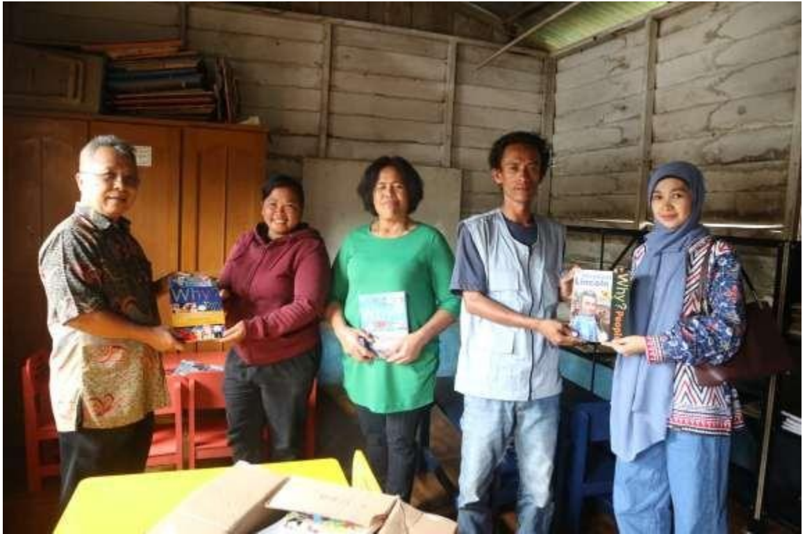
Gambar 4.2. Serah Terima Fasilitas Taman Baca kepada Masyarakat Desa

Selain itu karang taruna setempat juga diajarkan untuk mengisi buku daftar tamu, dan mendata buku-buku yang paling banyak dibaca dan mengawasi penggunaannya ada agar tetap awet dan terawat. Kemudian dampak yang dapat dirasakan masyarakat dari penyediaan taman bacaan ini adalah :