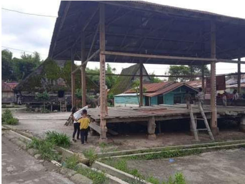
Gambar 1. 1 Lokasi Balai Desa Dokan

Oleh karena itu tim pengabdian ini tegrerek untuk mendirikan Taman bacaan di Desa Dokan ini yang bertujuan untuk membangkitkan kegemaran membaca, semangat belajar, membuka wawasan dan membangkitkan minat keingintahuan terhadap hal-hal baru melalui buku-buku.