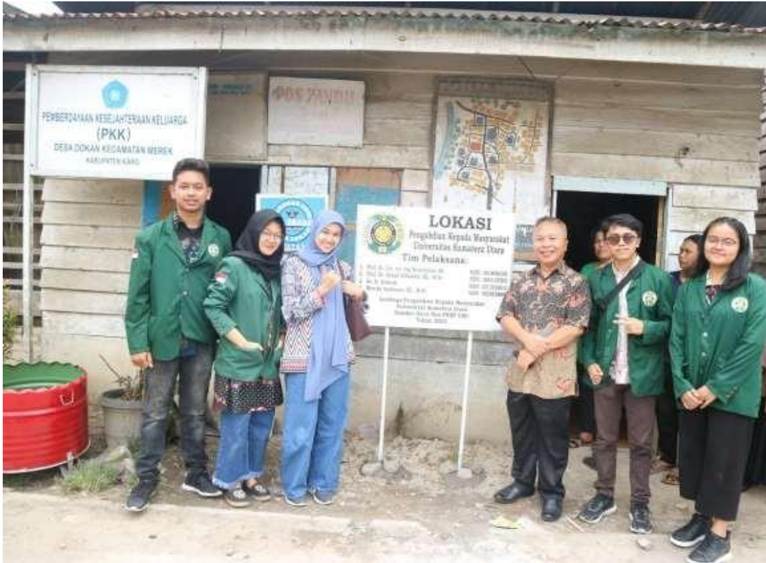
Gambar 4.1 Lokasi Taman Bacaan